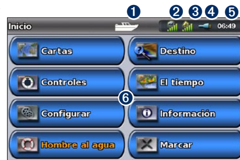
Modo náutico: pantalla Inicio