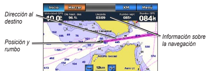
Navegación directa a un destino