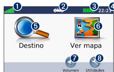
Modo para automóvil: página Menú