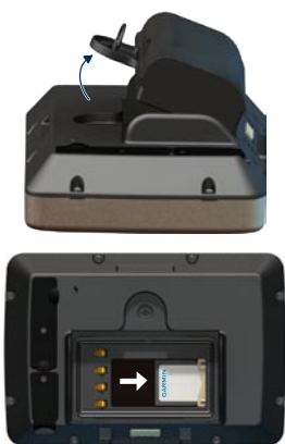
Inserción de una tarjeta SD