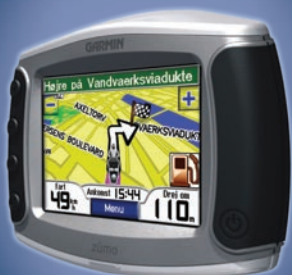
den personlige motorcykelnavigator

© 2006-2007 Garmin Ltd. eller dets datterselskaber