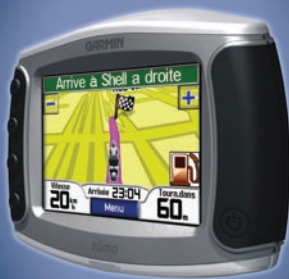
le navigateur personnel des motards