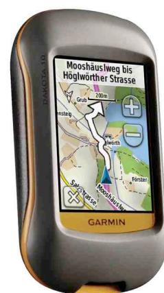
Garmin Dakota 10 mit Ausschnitt der Topo Deutschland Light