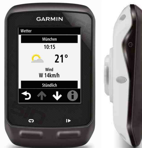
Edge 510 mit Echtzeit-Wetter