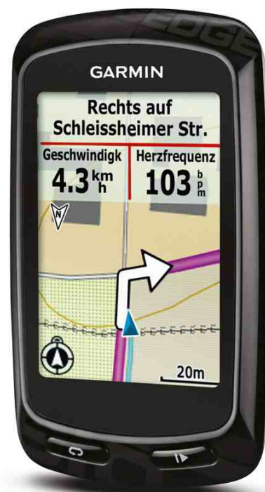
Routing auf dem Edge 810

Die wichtigste Neuerung beider Modelle sind aber diverse Online Funktionen dank Konnektivität mit dem Smartphone oder Tablet PC über eine Bluetooth-Schnittstelle . Über die Internetverbindung des Smartphones lassen sich so erstmalig Online-Funktionen wie Echtzeit-Wetter und sogar Live-Tracking direkt am Gerät nutzen. Mit Hilfe der zum Verkaufsstart ebenfalls neu erscheinenden Garmin Connect Mobile App (kompatibel mit Android und iOS: iPhone 4, 4S, 5 und demnächst auch iPad) können außerdem unterwegs Touren online gesucht und auf Edge