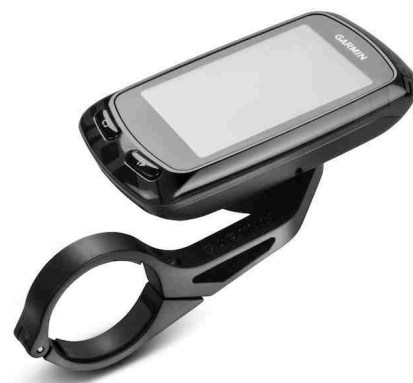
Edge 810 mit Aero-Lenkerhalterung

Garmin Connect ist eine maßgeschneiderte Online-Plattform für alle sportbegeisterten Menschen mit einem Garmin Fitness oder Sportcomputer. Mit ihrer Hilfe kann man alle sportlichen Aktivitäten dokumentieren, analysieren, Trainingspläne erstellen, Strecken anderer Nutzer suchen und sich dank neu hinzu gekommener Funktionen mit Gleichgesinnten austauschen oder messen. Mit bereits über 4,2 Milliarden – das ist mehr als 100.00 Mal um die Erde (und von der Erde zur Sonne sind es auch „nur“ 150 Millionen Kilometer) – von Nutzern hochgeladenen und täglich rund 270.000 neu hinzu kommenden Trainingskilometern ist Garmin Connect das größte und meistgenutzte Portal seiner Art. Diese Zahlen drücken die Beliebtheit des Portals und auch seine Benutzerfreundlichkeit aus. Die Deutschen sind übrigens besonders aktiv und liegen im internationalen Ländervergleich stets ganz vorne.