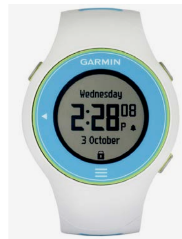
Forerunner 610 Limited Edition