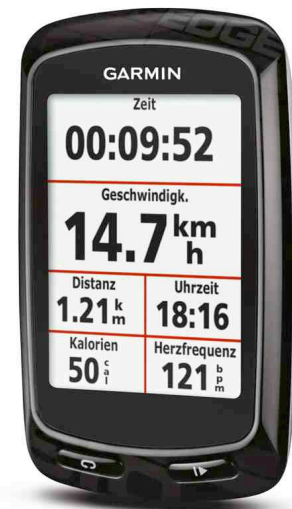
Garmins neuer High-End GPS-Radcomputer Edge 810

2. Aktion „Edge auf Tour“ mit Lern-Parcours: Noch besser als nur „selbst mal schnell probieren“ ist für interessierte Radler die Teilnahme an einem der Aktionstage „Edge auf Tour“. Mitarbeiter von Garmin betreuen einen speziell für Schulungszwecke entwickelten ‚GPS-Experience‘ Parcours. Dort können Radler die Edge Bike-Computer unter fachkundiger