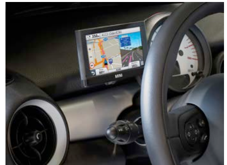
Das MINI Navigation Portable XL fügt sich nahtlos in den Fahrzeuginnenraum ein.

Das MINI Navigation Portable XL wird vom Händler mittels einer Halterung angebracht, die eigens für MINI entwickelt worden ist. Durch die Position neben der Lenksäule erhält der Fahrer alle wichtigen Informationen auf dem 4-Zoll-Bildschirm auf einen Blick. Sämtliche Kabel verbergen sich hinter dem Armaturenbrett, eine zusätzliche Stromversorgung über den Zigarettenanzünder ist nicht erforderlich. Für Karten- und Softwareaktualisierungen lässt sich das Gerät bei Bedarf unkompliziert entfernen.