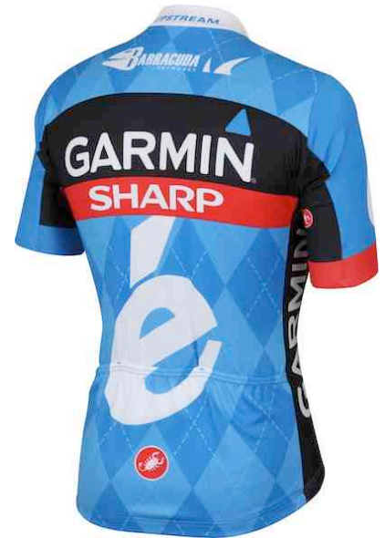
Ein „Argyle“-Muster besteht aus schachbrettartig angeordneten Blöcken, meist mit gekreuzten Streifen in einer Kontrastfarbe. Es stammt ursprünglich aus Schottland aus dem Tartan des Clans Campbell aus Argyll. Die Team-Trikots kommen traditionell mit einem Argyle-Design.

Weitere Information zum Team GARMIN Sharp-Barracuda unter http://www.slipstreamsports.com/