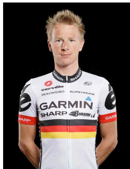
Fabian Wegmann ist amtierender Deutscher Meisters auf der Straße

Fest steht für 2013: Das Team Garmin-Sharp-Barracuda strebt nach noch besseren Ergebnissen. Der Kanadier Ryder Hesjedal ist heiß darauf, seinen Titel beim Giro d'Italia zu verteidigen. Andrew Talansky und Dan Martin wollen an ihre starken Ergebnisse bei den Etappenrennen anknüpfen. Tyler