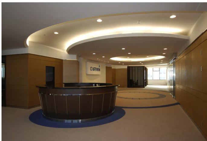
(Auto OEM office Shanghai)

Il Gruppo automotive OEM di Garmin produce una vasta gamma di soluzioni in-car per l'industria automobilistica, inclusi sistemi telematici e di infotainment, software di navigazione satellitare, servizi located based e sistemi PND integrati. Garmin ha stipulato accordi con le aziende più importanti del settore automotive quali BMW, Chrysler, Honda, Kenwood, Panasonic, Suzuki e Toyota. Il sistema di navigazione integrato di Garmin nella Dodge Charger si è aggiudicato il riconoscimento "Sistema di navigazione integrato maggiormente apprezzato dai clienti" 1 nello studio realizzato da J.D.Power e Associati sulla soddisfazione nell'uso dei navigatori satellitari in Usa nel 2011.