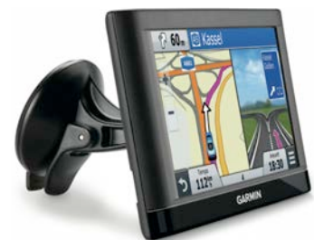
Das erste 6-Zoll-Navi von Garmin: nüvi 66

Die Einführung des Head-Up Displays (HUD) war 2013 ein großer Erfolg. Garmin knüpft daran an und stellt mit dem neuen HUD+ eine Weiterentwicklung vor, die auch für Autofahrer interessant ist, die bislang die NAVIGON oder Garmin App noch nicht auf ihrem Smartphone installiert haben. Käufer des HUD+ können sich die gleichnamige App im Apple App Store, bei Google Play oder im Windows Phone Store kostenlos herunterladen. Anschließend wird das Head-Up Display, das für jeden Fahrzeugtyp geeignet ist, auf dem Armaturenbrett angebracht und per Bluetooth mit dem Smartphone verbunden. Das Gerät projiziert alle