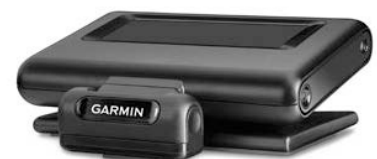
Ab sofort mit eigener App: Garmin HUD+