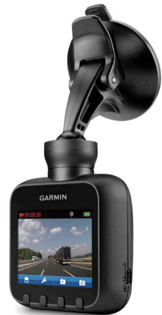
Dokumentiert das Verkehrsgeschehen: Garmin Dash Cam

Weitere Informationen unter www.garmin.de