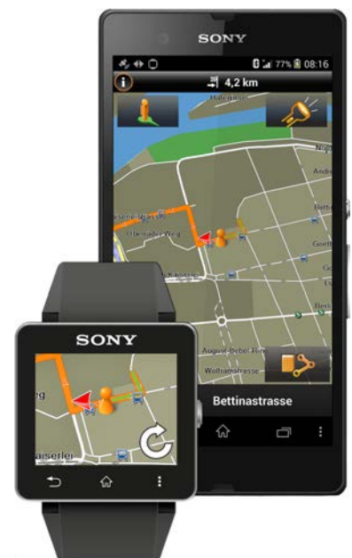
Garmin Xperia Edition: Mobiler Guide für Sony Smartphones und SmartWatch 2

Die neue Xperia Edition beinhaltet eine Reihe von bewährten Garmin Funktionen. Dank onboard Kartenmaterial finden Nutzer den Weg selbst dann noch, wenn kein stabiles Netz zur Verfügung steht. Eine leicht zu bedienende Nutzeroberfläche erleichtert die Suche nach Points of Interest (POI) sowie die Adresseingabe. Nutzer können mit der App bequem bei Foursquare einchecken, ihren Standort via Glympse teilen oder auf Wikipedia zugreifen. Der Reality Scanner liefert zusätzliche Informationen zu Sehenswürdigkeiten in der Nähe, indem er in das Kamerabild passende Hinweise integriert. Für Autofahrer ist die Navi-App ein vorbildlicher Beifahrer und warnt rechtzeitig vor Geschwindigkeitsüberschreitungen. Kreuzungen und Ausfahrten stellt sie in realistischen Bildern dar und sorgt mit 3D-Kartenansichten für mehr Orientierung. Die Funktion Live Traffic meldet Staus auf der Route und bietet Alternativrouten an. Ein großes Plus: Die App speichert die Position