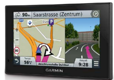
High-End Ausstattung in der Mittelklasse: Garmin x9er Serie

Alle Modelle der neuen Advanced Serie haben Bluetooth an Bord und können so schnell mit dem Smartphone verbunden werden. Die kostenlose Garmin App Smartphone Link bietet vielfältige Live Dienste wie Verkehrsinformationen, Benzinpreise, Wetter oder Foursquare. Wie auch Live Traffic via DAB+ überträgt Smartphone Link Verkehrsinformationen digital über das Verkehrsprotokoll TPEG. Im Vergleich zu TMC basierten Systemen unterstützt der TPEG Standard eine deutlich genauere Anzeige von Staus oder anderen Verkehrsbehinderungen – nämlich auf bis zu zehn Meter. Damit erhalten Nutzer auch per Smartphone detailliertere Echtzeitinformationen für eine noch sicherere Fahrt. Garmin Live Traffic via Smartphone Link ist besonders interessant in Gegenden oder Ländern,