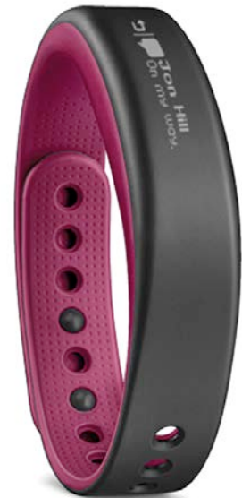
Garmin vivosmart: elegantes Design und smarte Features