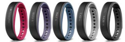
Große Auswahl: Garmin vivosmart ist in zwei Größen und fünf Farben erhältlich