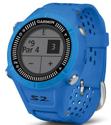
Neues Design: Die beliebte Approach S2 ist in Kürze in hellblau verfügbar

Weitere Informationen und hochauflösendes Bildmaterial gibt es unter http://www.garmin.de/presse/