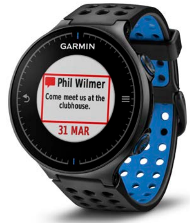
Die neue Approach S5: Dank Smart Notifications immer informiert

Weitere Informationen unter www.garmin.de