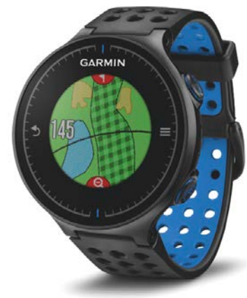
Mit Farb-Touchscreen und vollständiger Platzansicht: Die neue Approach S5

Die Approach S5 verfügt über eine digitale Scorecard, die sich über die Plattform oder Mobile App Garmin Connect speichern, auswerten oder mit anderen Nutzern teilen lässt. So erhalten Spieler detaillierte Statistiken zu