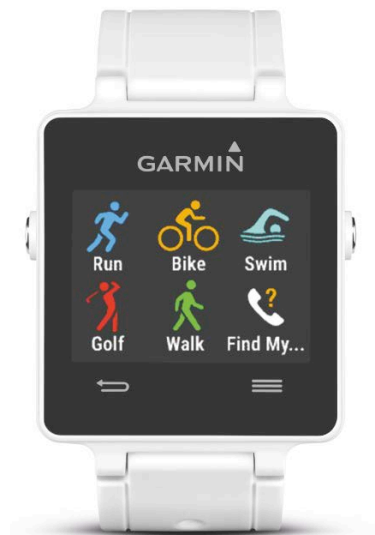
Dank unterschiedlicher Profile der perfekte Begleiter bei vielen Sportarten