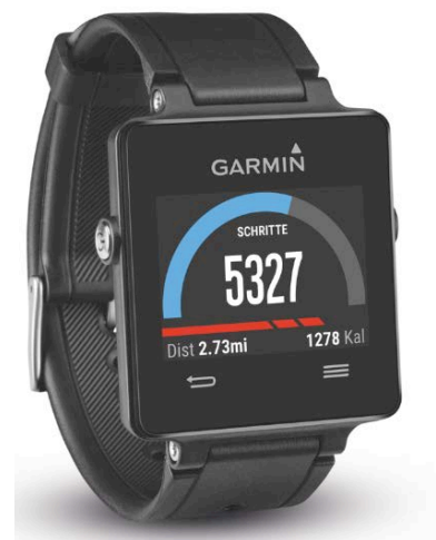
Smarter Schrittzähler mit zahlreichen Funktionen: Garmin vivoactive

Auch im Alltag motiviert vivoactive zu einem aktiveren Lebensstil dank Schrittzähler und individuellen Tageszielen, die sich am Leistungsniveau des Trägers orientieren. Der Inaktivitätsmesser erkennt, wann es wieder Zeit wird, sich zu bewegen, und weist mit einem roten Balken auf dem Display darauf hin. Zudem haben Nutzer die Möglichkeit, sich weitere Daten wie die verbrauchten Kalorien anzeigen zu lassen.