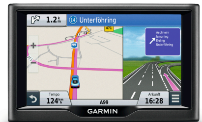
Neu: Die Garmin nüvi Essential Serie 2015 mit 5- und 6-Zoll Displays

Die Integration von mehr als 1,5 Millionen Points of Interest aus Foursquare unterstützt den Fahrer dabei, etwa Restaurants oder Geschäfte entlang seiner Route oder an unbekanntem Zielorten zu finden.