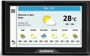
Figura 3: Garmin Drive 52

I modelli Garmin DriveSmart 55 e Garmin DriveSmart 65 sono compatibili, inoltre, con la nuova app Garmin Drive™ , mentre il modello Garmin Drive 52 è compatibile con l'app Smartphone Link . Una volta scaricata la rispettiva applicazione, il navigatore satellitare potrà connettersi in modalità wireless con il proprio cellulare in modo tale da ricevere sul proprio dispositivo notifiche quali sms, e-mail e telefonate, oltre a informazioni in tempo reale riguardo a dati sul traffico, aggiornamenti meteo e informazioni su parcheggi e, soprattutto, avvisi dalla propria retrocamera Garmin BC™30 che sfrutta lo schermo del navigatore per mostrare in streaming le immagini catturate da dietro l'abitacolo.