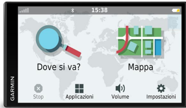
Figura 1: Garmin DriveSmart 55

Il sistema satellitare GALILEO è nato da un progetto europeo (convive nella nuova famiglia Garmin Drive con quello GPS di estrazione americana) ed è stato realizzato per un utilizzo civile: una caratteristica, quest'ultima, che non lo rende soggetto alle limitazioni tipiche di altri sistemi di posizionamento satellitare. I tecnici Garmin, dopo aver riscontrato come un singolo processore satellitare non fosse sufficiente per ricevere il segnale in situazioni particolarmente difficili come boschi fitti o strade impervie di montagna, hanno deciso di affiancare i due sistemi satellitari GALILEO e GPS per un'esperienza di assistenza alla guida efficiente ed efficace.